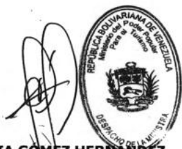
LETICIA CECILIA GÓMEZ HERNÁNDEZ MINISTRA DEL PODER POPULAR PARA EL TURISMO