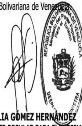
LETICIA CECILIA GÓMEZ HERNÁNDEZ MINISTRA DEL PODER POPULAR PARA EL TURISMO