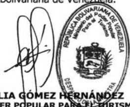
LETICIA CECILIA GÓMEZ HERNÁNDEZ MINISTRA DEL PODER POPULAR PARA EL TURISMO